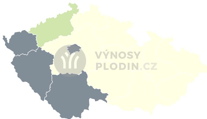
Odchylka výnosu [%]