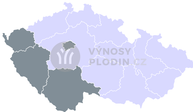
Nejistota odhadu [%]