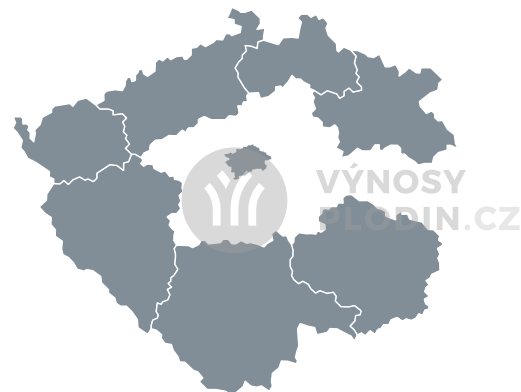
Odhadované dopady sucha na výnos