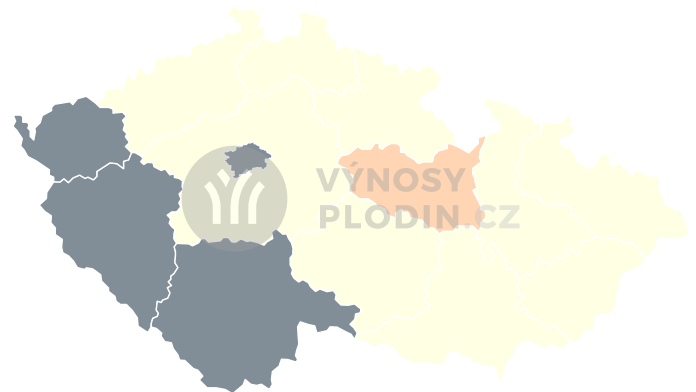
Odchylka výnosu [%]